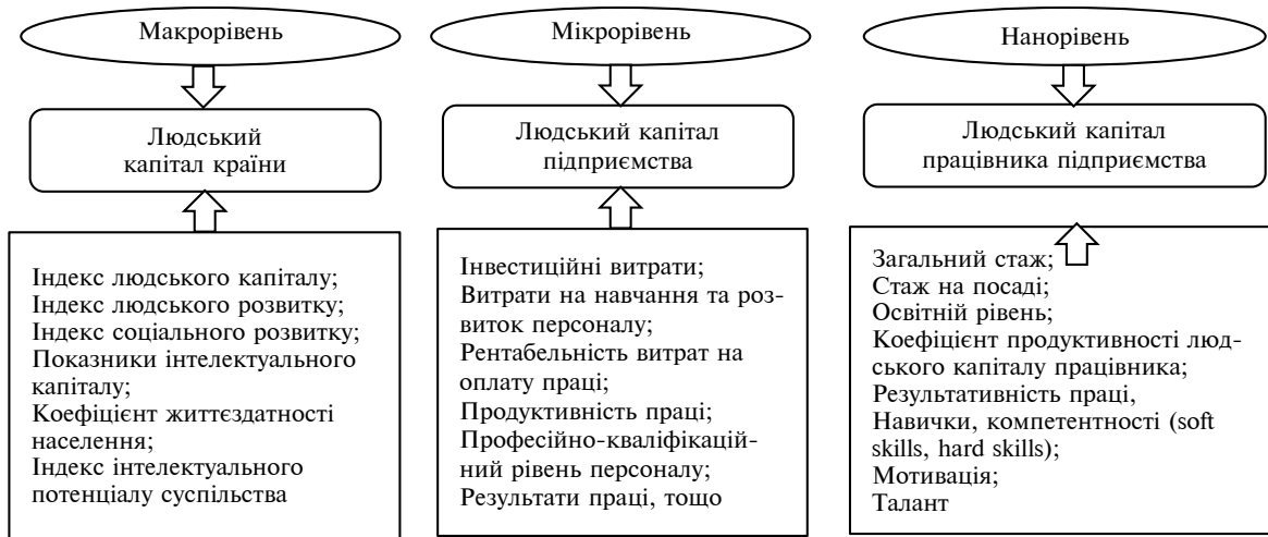
Рис. 3. Класифікація показників людського капіталу за рівнями оцінки

ського капіталу дозволяє проводити комплексний аналіз від формування людських ресурсів кожної особи (індивідуума) до впливу людського капіталу країни на розвиток суспільства (рис. 3).