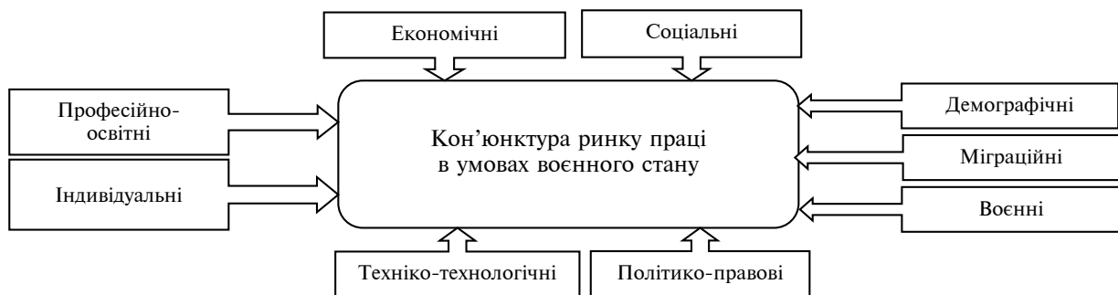
Рис. 1. Чинники, які впливають на ринок праці в умовах воєнного стану

Класифіковано дев'ять груп основних чинників, які впливають на кон'юнктуру ринку праці у воєнний час: економічні, соціальні, демографічні, міграційні, політико-правові, техніко-технологічні, професійно-освітні та індивідуальні та безпосередньо, воєнні (рис. 1).