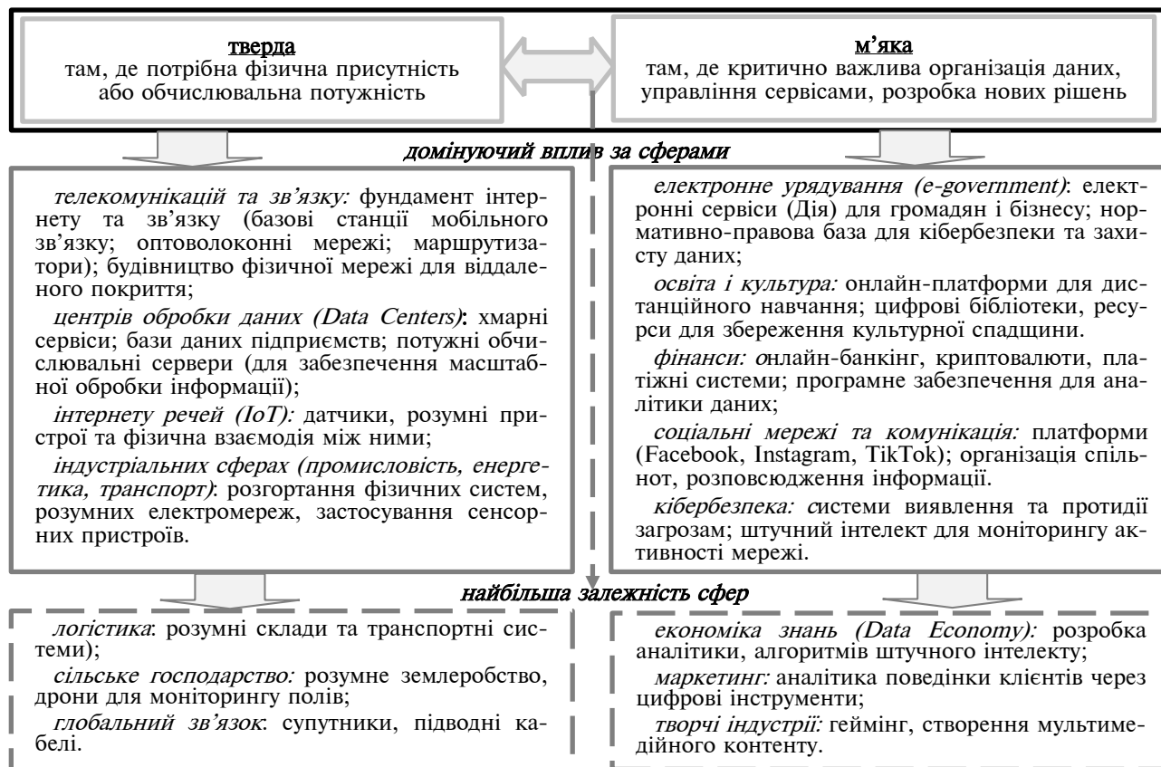
Рис. 1. Взаємозв'язки компонент цифрової інфраструктури